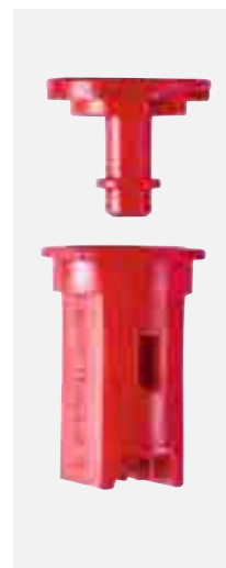
inyector desmontable sin herramientas